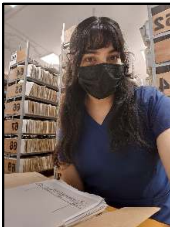
Foto 2. Evidencia de trabajo propio