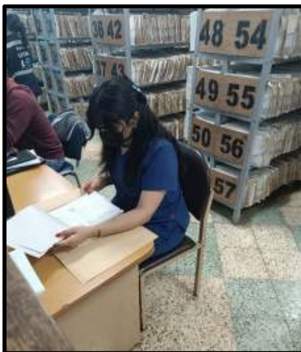
Foto 1. Revisión de historias clínicas