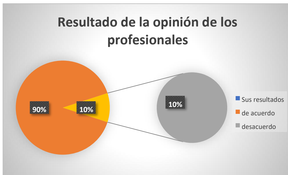
Figura 2: Resultado de la opinión de los profesionales

al otro 20 % y los jueces de la investigación preparatoria el otro 20 %, haciendo el total del 100 %.