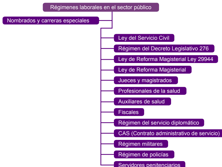
Figura 2. Regímenes laborales en el sector público