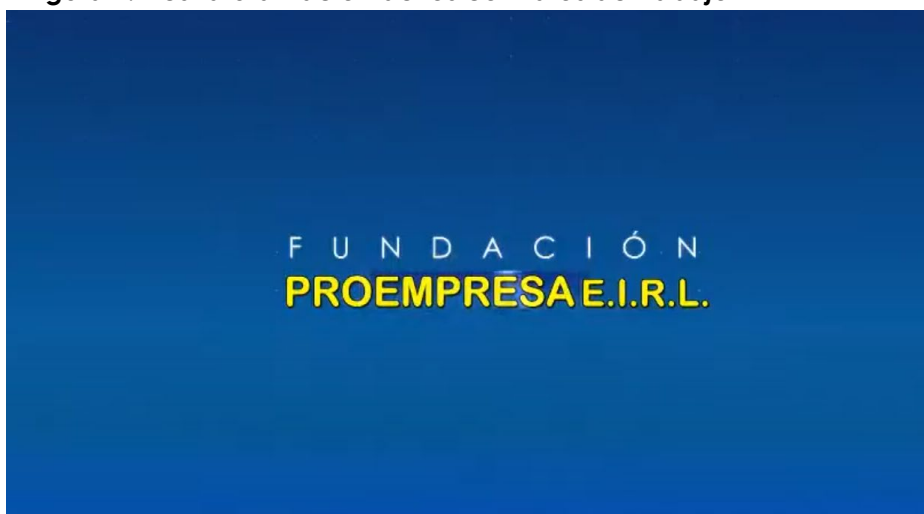
Tomada del canal de Fundación ProEmpresa E.I.R.L. (26 de mayo de 2018)

b) En base a la discusión, redactan la postura del equipo con respecto a los objetivos e importancia de los contratos desnaturalizados.