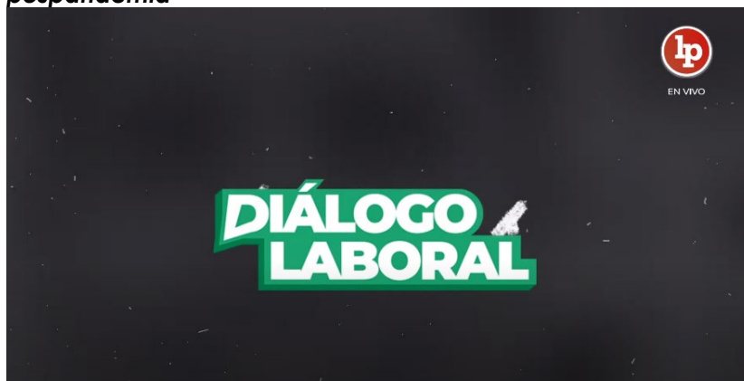
Tomada del canal LP - Pasión por el Derecho (8 de julio de 2020)

Figura 3. Despidos en cuarentena: sepa qué hacer ante un despido arbitrario pospandemia