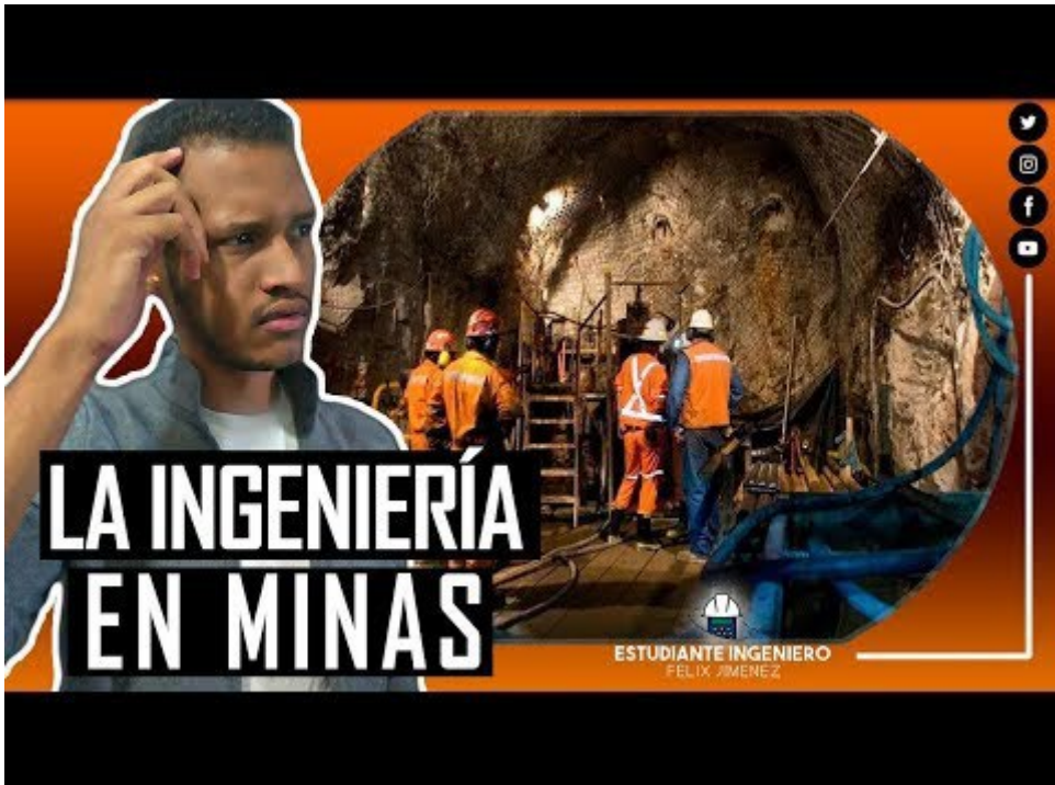
Tomada de LA INGENIERIA EN MINAS | FELIX JIMENEZ (22 de octubre de 2018)