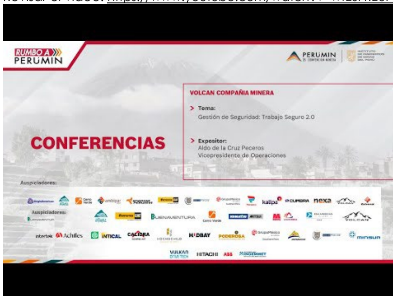
Tomada del Instituto de Ingenieros de Minas del Perú (5 de mayo de 2022)