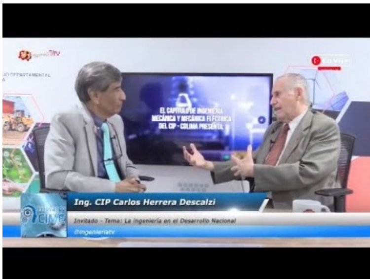
Tomada de Ingeniería TV (18 de enero de 2023)