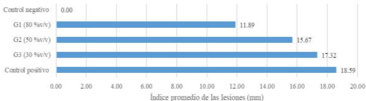
Figura 2. Actividad microbiológica del jengibre ante Helicobacter pylori

En cuanto a la actividad microbiológica del jengibre ante Helicobacter pylori se pudo evidenciar que las lesiones en la mucosa intestinal del grupo (G3) que se le administró el concentrado 30 %v/v fue de 17,32 mm, G2 (50 %v/v) de 15,65 mm y G1 (80 %v/v) de 11,89% en comparación al control positivo que fue de 18,59 mm y control negativo de 0,00 mm respectivamente (Figura 2).