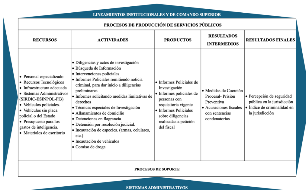
Cadena de Valor Pública de los Departamentos de Investigación Criminal

Desde la conformación del Equipo Especial de la PNP, se han abordado diversos casos como los anteriormente mencionados. Los resultados obtenidos han restaurado la confianza en la autonomía y capacidad de las agencias estatales persecutoras del delito, ya que se demostraron suficientes elementos de convicción de alta probanza y se identificaron conductas obstruccionistas