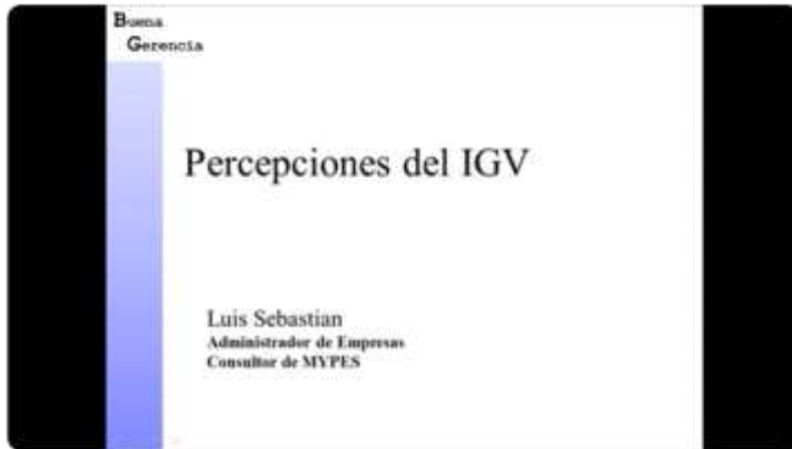
Percepciones del IGV - SUNAT