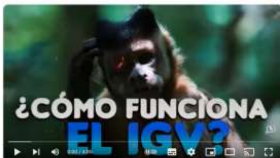
Cómo funciona el IGV en el Perú

https://www.youtube.com/watch?v=H9pk-r9EDcM&t=40s