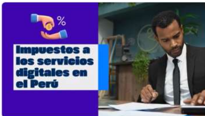
Impuesto del IGV a los Servicios Digitales en el Perú

https://www.youtube.com/watch?v=BgBLfUvdCw0