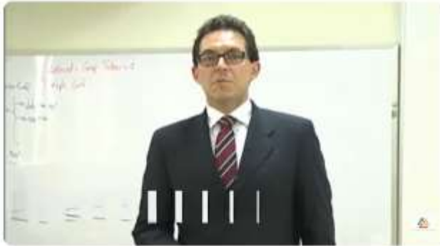
1) Sistema de Dedicaciones - ¿Que es el Régimen de Dedicaciones?

Tomada del canal Capsulas Empresariales (16 de abril de 2020)