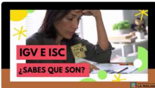
Ley del Impuesto General a las Ventas e Impuesto Selectivo al Consumo - IGV e ISC

https://www.youtube.com/watch?v=VcLztHwK1c8&t=33s